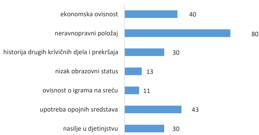
Grafikon 1: Faktori rizika za nasilje u porodici

Istraživanje o utjecaju provedbe zaštitnih mjera definiranih Zakonom o zaštiti od nasilja u porodici je pokazalo da 29,21% žrtava i 28,32% počinitelja nasilja nikad nije bilo zaposleno 15 . Također, kod osoba koje su počinile nasilje u porodici u 26,16% slučajeva registrovan je i neki od drugih oblika krivičnih djela osim nasilja u porodici, a u 30,06% i neki od oblika prekršaja. Prema Istraživanju o dobrobiti i sigurnosti žena u BiH, žene slabijeg materijalnog stanja češće su iskusile neki od oblika nasilja počinjen od intimnog partnera u odnosu na one boljeg materijalnog stanja 16 .